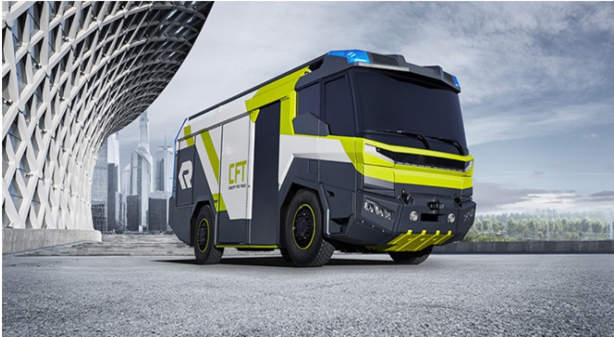
Afbeelding van de elektrische CFT (Concept Fire Truck) die als pilot getest wordt in Berlijn, Amsterdam en Dubai

Als 's Nachtwachts brandtgeroep de burgers doet ontwaeke Heeft iedre spuitgast sorg tot hulp sich optemake En spoedigts met de spuit sich brandwaerts te begeven, Om daar het plunderend vuur met haeste te doen sneven Hij sal dus onversaegt, bij 't luiden van de klokken, Het angstig vuurgeweld bestrijden onverschrokken, Tot nut van 't algemeen, tot delding van de jammers Van het ontstelde volk, 't zij Oost of West Zaandammers.